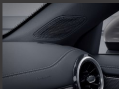
Advanced Sound System (853)