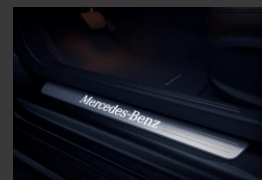
Verlichte instaplijsten (U25)