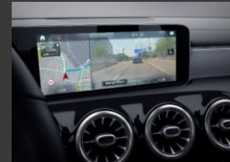
Augmented reality voor navigatie (U19)