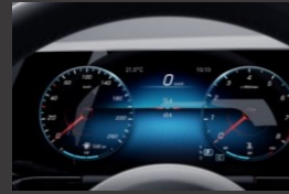
Widescreen cockpit (458)