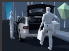
KEYLESS-GO package (P17)